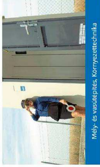
Mély- és vasútépítés, Környezettechnika